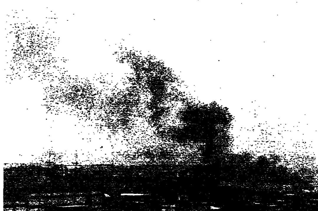
دخان اسود كيف يصاعد من مصنع دبارو للسيج

في بيروت استمرت الاشتباكات طوال امس، في حضور القضاة - ويصير - في منطقة الشياح - جسر الماشا - الذمة - الشياح - الرمانة بالاضافة الى جميع مياه بيروت - ويبلغ القواصق يتران مع انواع نيران الصواريخ والذمة من قبل الجيش - امس -